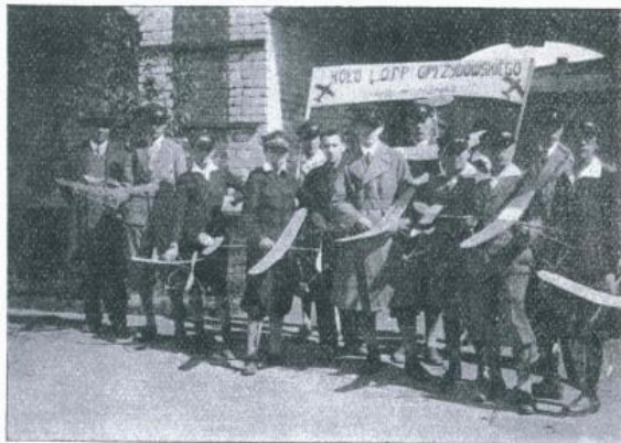
Koło L. O. P. P. (Konkurs modeli)