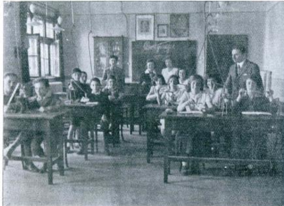
Lekcja fizyki w pracowni

Organizujemy wystawy poświęcone ważnym dla świadomości narodowej rocznicom, wydarzeniom, bohaterom i autorytetom moralnym w dziejach narodu. Naszą pracą wychowawczą zasłużyliśmy na chlubne imię patrona gen. Augusta E. Fieldorfa "Nila", które otrzymaliśmy w roku 2004.