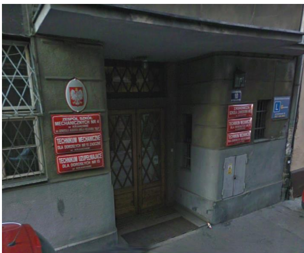
Wejście do szkoły, ul. Podbrzezie 10.

Zespół Szkół Mechanicznych Nr 4 w Krakowie to szkoła z długoletnią tradycją. Od ponad stu lat znajduje się na Kazimierzu, a od blisko 60 kształci na kierunkach związanych z mechaniką. W roku szkolnym 2019/'20 w ZSM4 zaszły bardzo duże zmiany – zaczynając od kadry kierowniczej, a na filozofii nauczania kończąc. Nasz zespół składa się z czterdziestu doświadczonych nauczycieli, w tym czterech to doktorzy nauk. Stawiamy na specjalistów w swoim fachu, dlatego część z nich oprócz nauczania jest również aktywna zawodowo pracując przykładowo na lotnisku czy w warsztacie samochodowym.